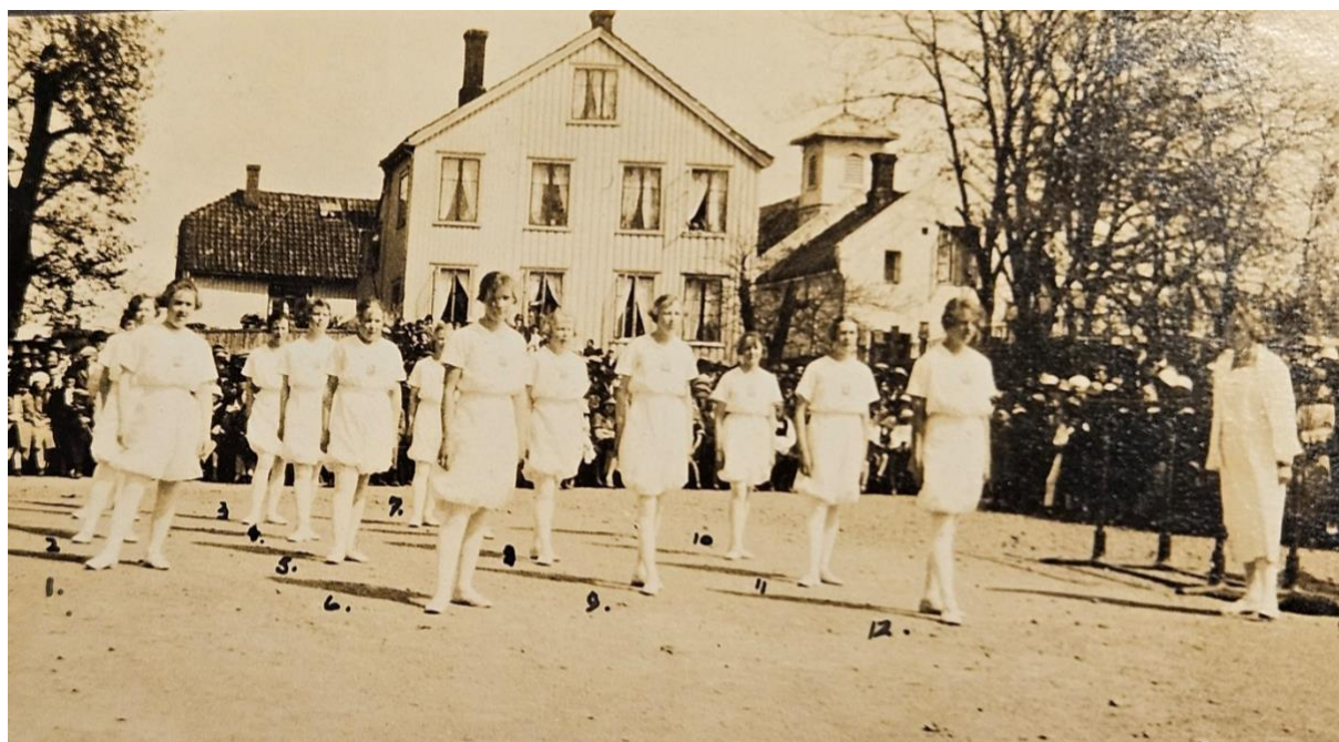
Arendals Turnforenings dametropp. Oppvisning på Kilebakken, Tyholmen - 17. mai 1925.

Innhold: Resultatregnskap Balanse Noter Kontrollutvalgets beretning/revisjon